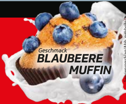
Geschmack BLAUBEERE MUFFIN

Verzehrempfehlung: 30g Pulver (1 Dosierlöffel = 1 Portion) mit 250ml Wasser oder 300ml Milch in einem Shaker mixen. Trinken Sie 1 Shake täglich, am besten zum Frühstück, als Zwischenmahlzeit, vor oder direkt nach dem Training. Außerhalb der Reichweite von kleinen Kindern aufbewahren. Kein Ersatz für eine ausgewogene und abwechslungsreiche Ernährung sowie eine gesunde Lebensweise. Den praktischen ALL STARS Shaker Cup können Sie auf www.all-stars.de oder telefonisch unter +49 8803/637 40 bestellen. Zutaten: Molkenweiß-Konzentrat, Molkenweiß-Isolat, Aroma, Verdickungsmittel Xanthan, Emulgator Lecithine (Soja), Farbstoff Pflanzenextrakt (Soja), Süßungsmittel Acesulfam K und Sucralose, Speisesalz, Trennmittel Siliciumdioxid (Kieselsäure). Allergienhinweis: Enthält: Milch, Laktose und Soja.