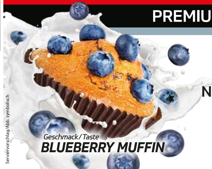
Geschmack/Taste BLUEBERRY MUFFIN